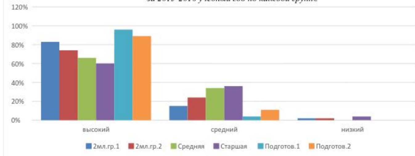
уровни выполнения программы МБДОУ "Детский сад № 36 "Звёздный" за 2015-2016 учебный год по каждой группе